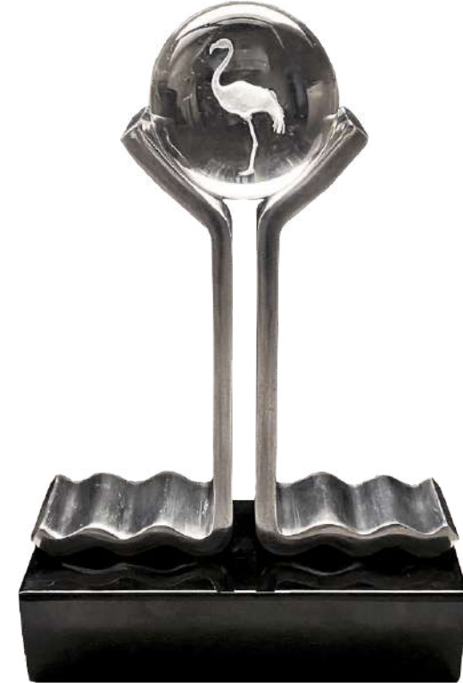
Kristal Flamingo ödülleri - Tasarım: Sema Topaç