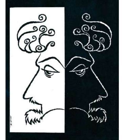
Necati Abacı'nın Şahin Kaygun karikatürü.

Esat Erçetingöz'den İzmir'in Flamingoları Dijital Fotoğraf Sergisi / Flamingos of İzmir Digital photography Exhibition İstinyePark Teras